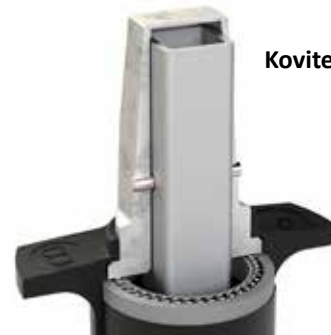
Kovitettu akselin kansi