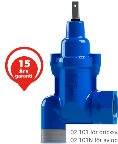
02.101 för dricksvatten 02.101N för avloppsvatten

Fullt vulkaniserad kägla med fixerad spindelmutter i avzinkningshärdig CW617N mässing (accepterad på UBA lista). 4 spindeltätningar säkerställer lång hållbarhet.